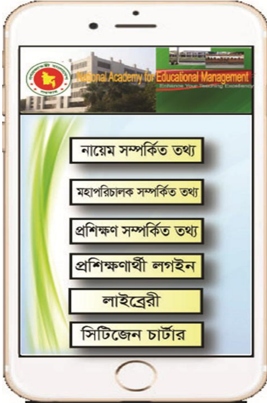
এ্যাপের কভার পেইজ