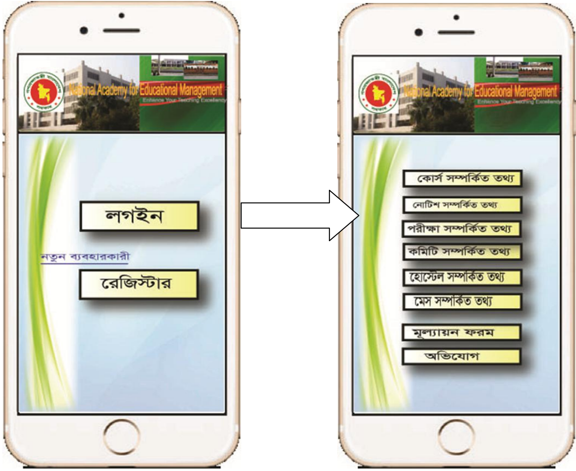
লগ-ইন ও নতুন রেজিস্ট্রেশন