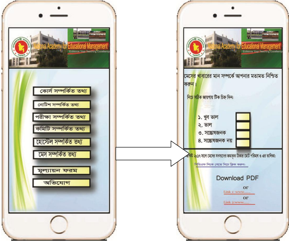
খাবার মিলের যাবতীয় তথ্য