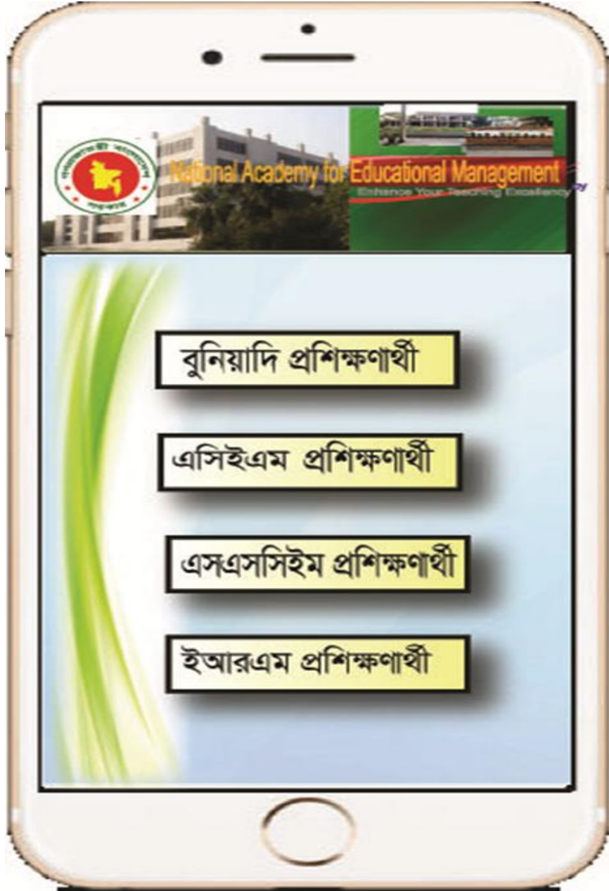
বিভিন্ন প্রশিক্ষণের লগ-ইন ও রেজিস্ট্রেশন