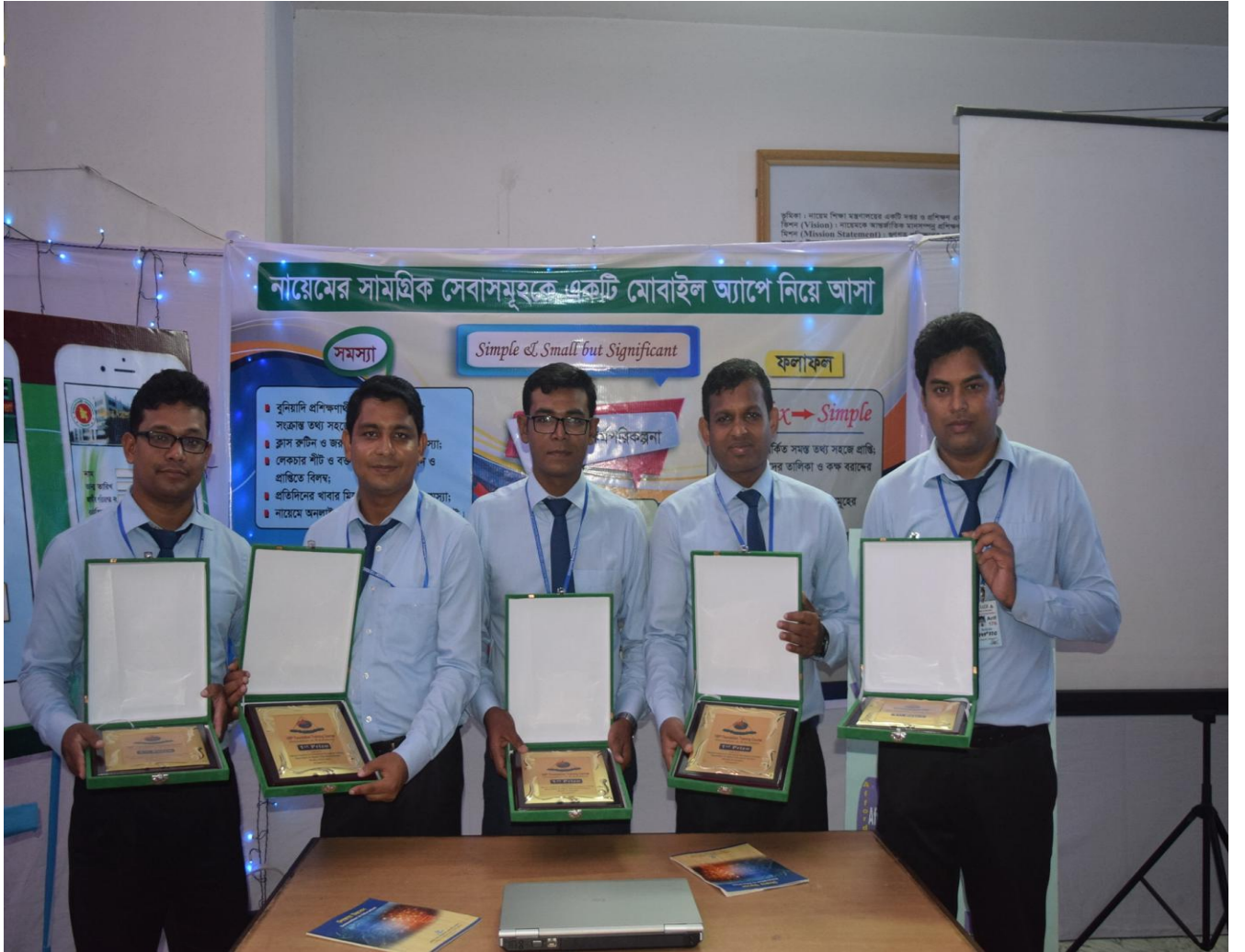
ইনোভেশন শোকেসিং-এ বিজয়ী হওয়ার পর গ্রুপ ছবি